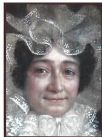
Henriette Aymer de la Chevalerie

Los fundadores fueron el Buen Padre, Pierre Coudrin y la Buena Madre, Henriette Aymer de la Chevalerie y laicos que hacían la Adoración al Santísimo Sacramento del Altar.