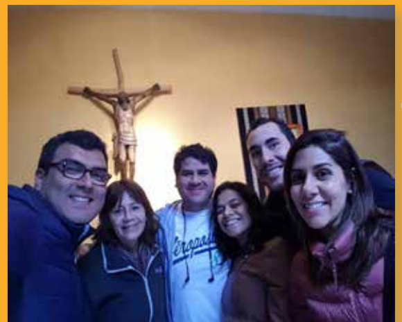
Comunidad José Kuwae, Lima Perú

Luego de algunos meses de reuniones muy frecuentes, la comunidad ha bajado un poco la frecuencia. Actualmente, se están reuniendo una vez al mes, siempre de manera virtual. Por supuesto, siguen trabajando con mucha constancia los temas que se propusieron y programaron a comienzo de año. En su última reunión, trabajaron el tema de la muerte: cuál es la visión cristiana de ésta, las distintas maneras de procesarla cuando sucede a alguien cercano, la importancia de prepararse para ese momento. El próximo mes tendrán su reunión navideña junto con la comunidad Misericordia en Acción.