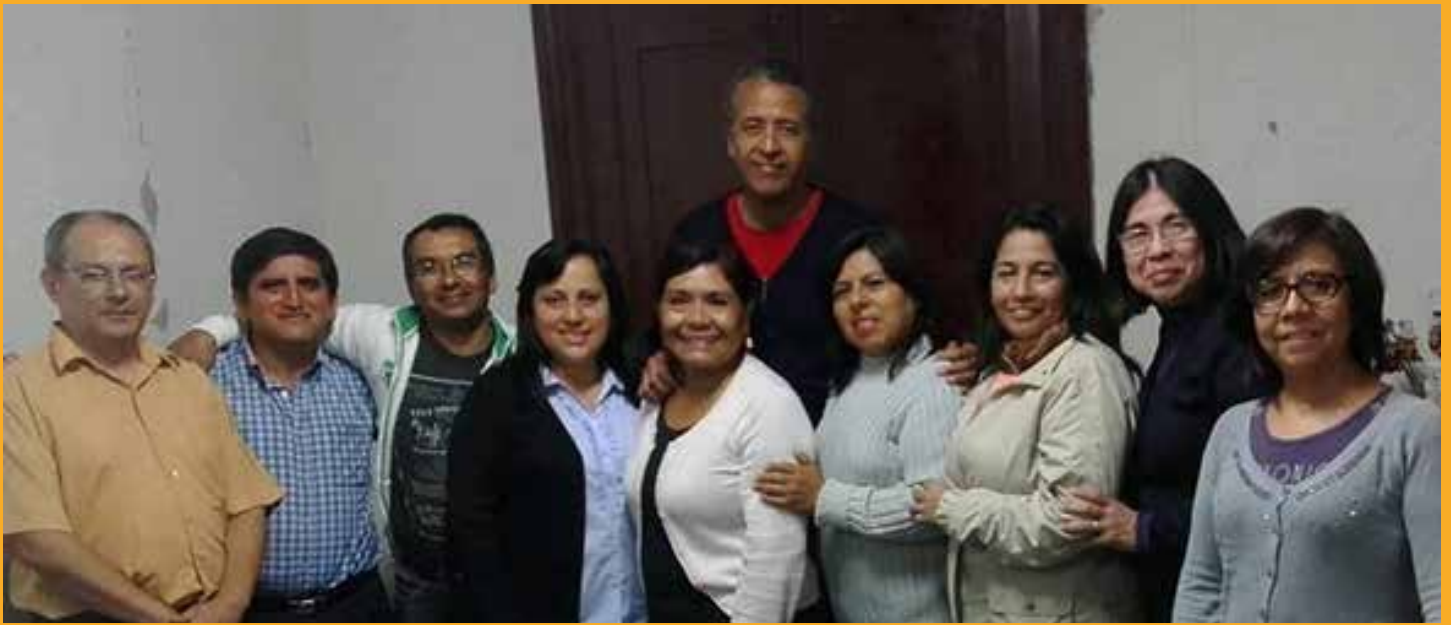
Comunidad Nicolás Castel, Lima Perú