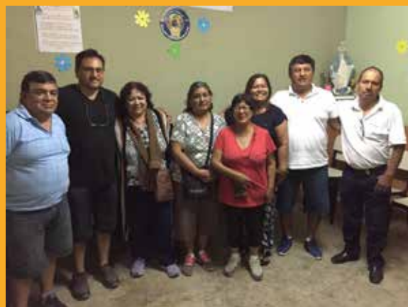
Comunidad Marcel Tregouet, Lima Perú