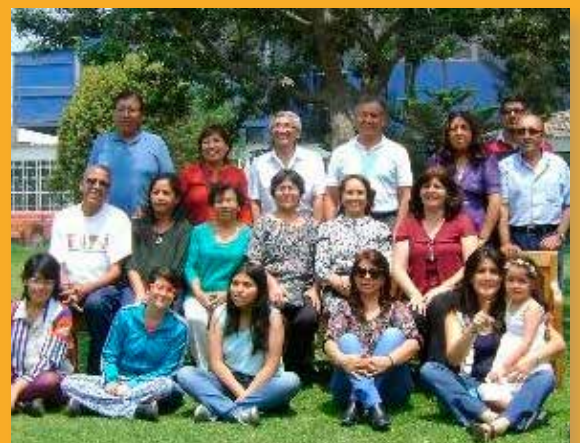
Comunidad Padre Eustaquio, Lima Perú