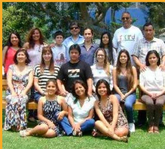
Comunidad Misericordia en Acción, Lima Perú