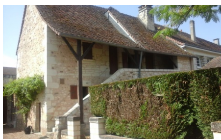
Maison du BP