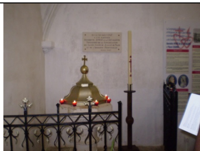
Baptistère, Bon Mère