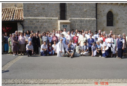
Place de la Bonne Mère