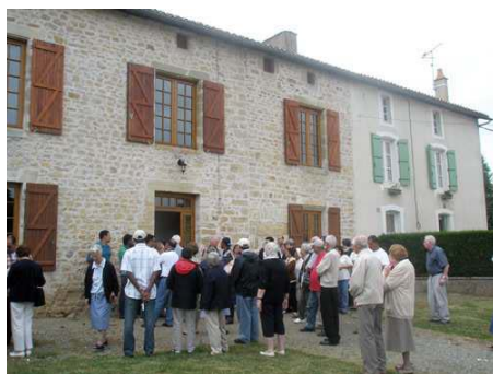
Château de la Chevalerie