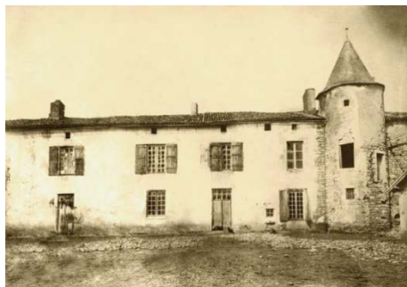
Château de la Chevalerie