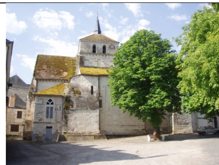
Église de Notre Dame